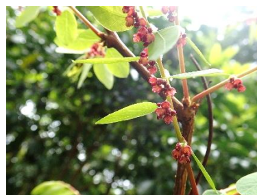
コバンノキ花がさいています