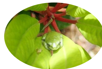
ユズリハにカエル (シュレーゲルアオガエル)