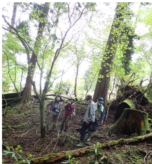
谷は新芽の柔らかな緑がきれい

開花しているもの、ヤマナシ、ウリハダカエデ、ヤブツバキ、コバンノキ、サンショウ、シキミ、チドリノキ、ミツデカエデ。蕾を付けているもの、シラキ、ウワミズザクラ、ゴマギ。シナノキはこれからかな？