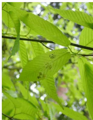
チドリノキの果穂が下垂