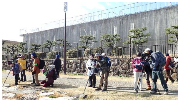
お昼寝中のカモ達をゆっくり見られました

令和初の新年の観察会です。良い天気恵まれ、風も比較的穏やかで観察しやすい一日になりました。