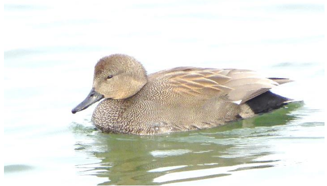
オカヨシガモ (小紋柄みたいにきれいな羽)