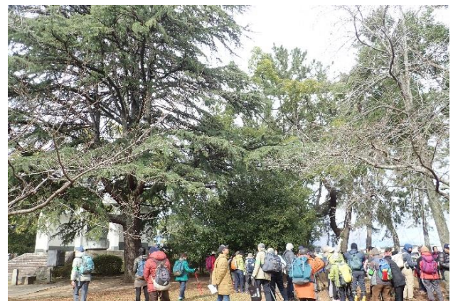
公園内にはメタセコイア・ラクウショウ・ヒマラヤスギなどもありヒマラヤスギの下ではみんながシダーローズ探しに夢中でした