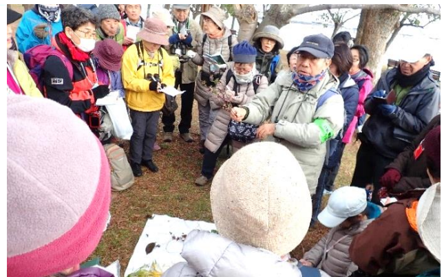
友の会恒例の店開き子どもが拾ったヒシの実もありました