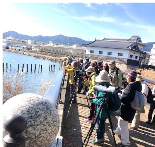
鳥を解説付きでみられて最高！！