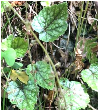
チャルメルソウ「夏には姿を消していくんやで・・・」