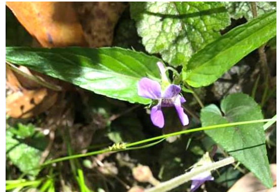
ナガバタチツボスミレ