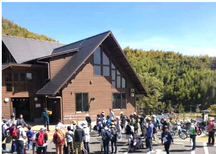
総勢50人！オリエンテーションのあと出発！

今、竹林が落葉の時で、木々の若葉と真逆で黄色くなっていました。外にクスノキも今がその時です。という話がありました。