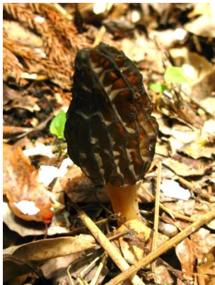
トガリアミガサタケ