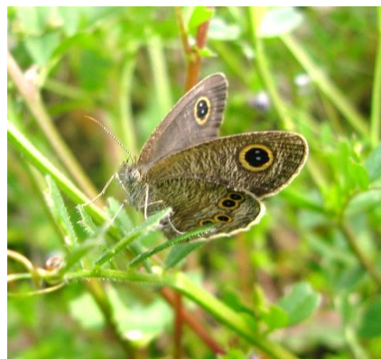
ヒメウラナミジャノメ