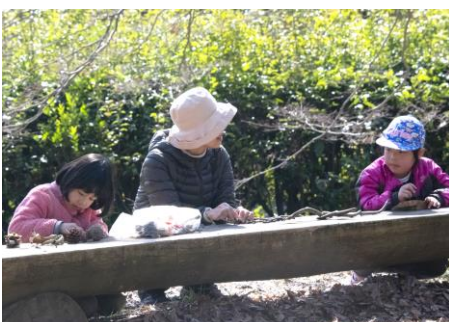
拾った松ぼっくりや木の葉であそんだよ