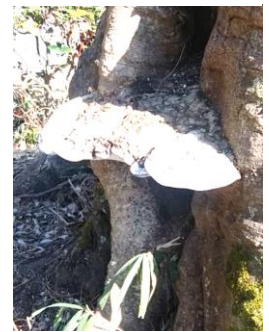
大きなサルノコシカケ sp.