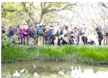
出水の小川でセキショウの花を観察