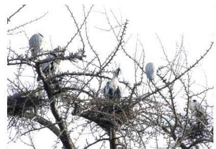
アオサギのコロニーとなったイチヨウ