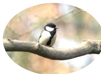
ネクタイが素敵なシジュウカラ