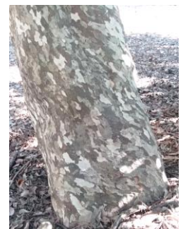
カゴノキの木肌が鹿の子模様